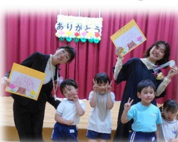
どんぐりグループのプレゼント 『キラキラメダル』