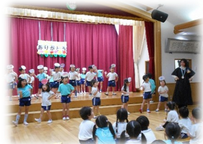
さくらグループのプレゼント ダンス『ぐるるんグルメショータイム ～はじめてのたんさん～』